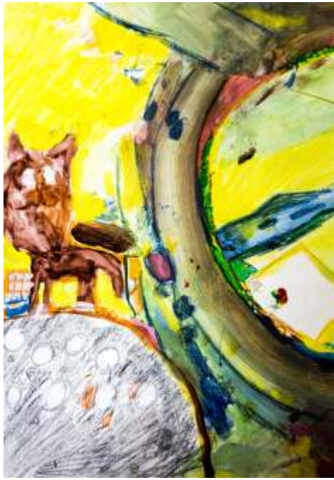
Zofia Perchon Chotomów