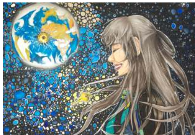
Maja Strzelczyk, Łódź