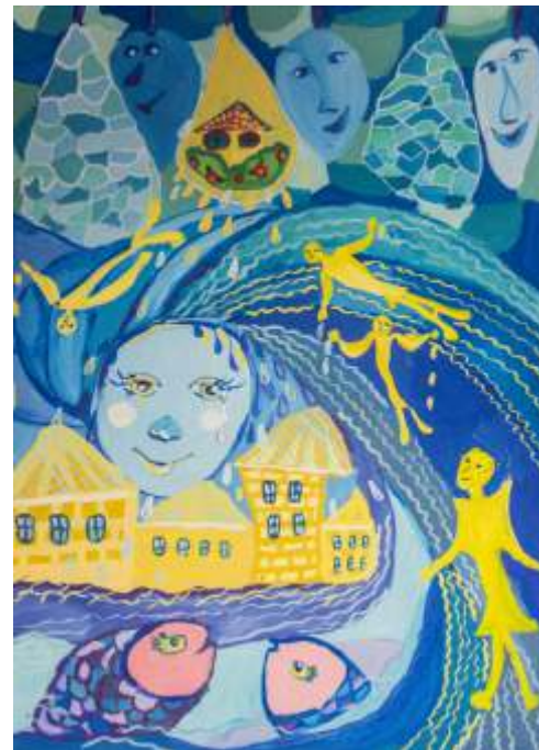
Polina Novik Soligorsk, Belarus