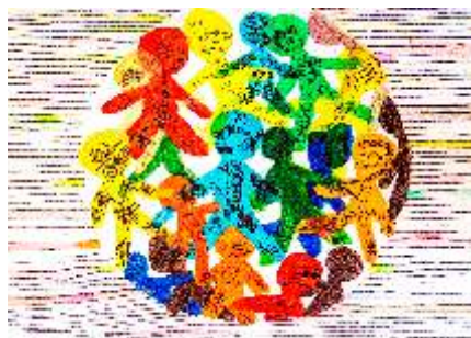
Wiktoria Nowacka Słupsk