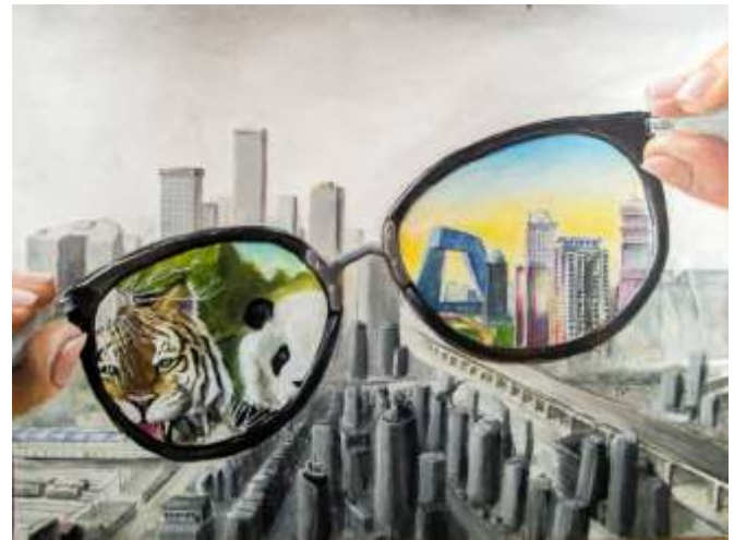
Ronja Asche , Rahden, Germany