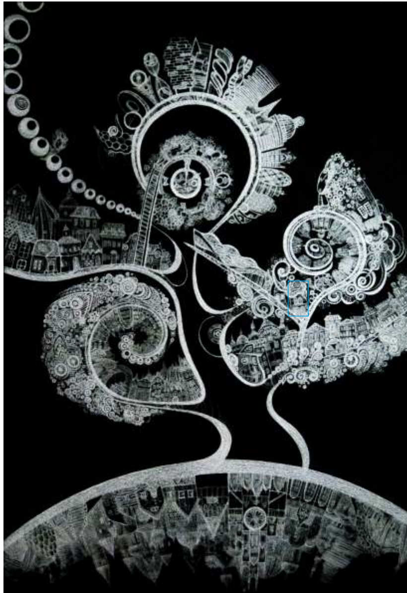
Natalya Pan'kova 15 lat Białoruś/Belarus, Brześć/Brest