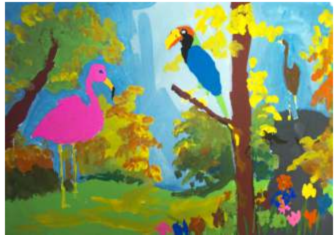
Kira Trubina, Pavlodar, Kazakhstan