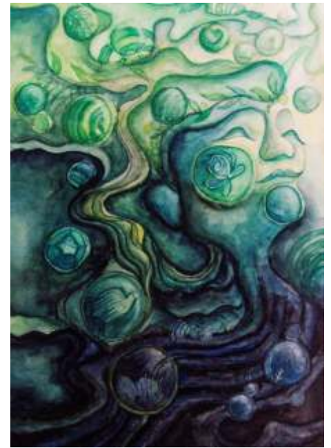
Chan Lok Ching Hong Kong, China