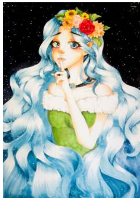
Waleria Morska Poznań