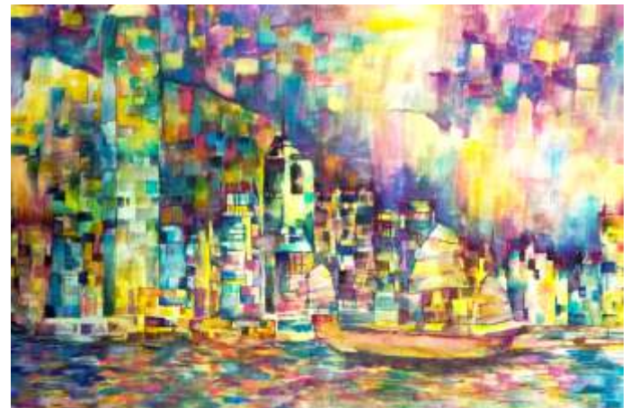
Wong Ching Tung, Hong Kong, China