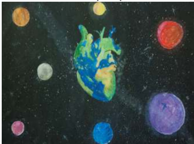
Amelia Byszewska Charzykowy