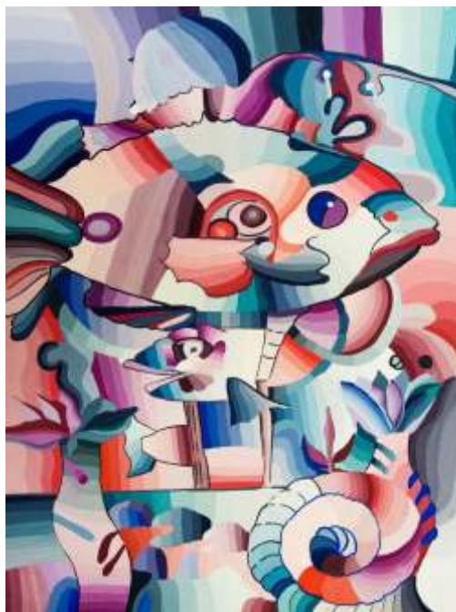
Anastasiya Rabava Soligorsk, Belarus