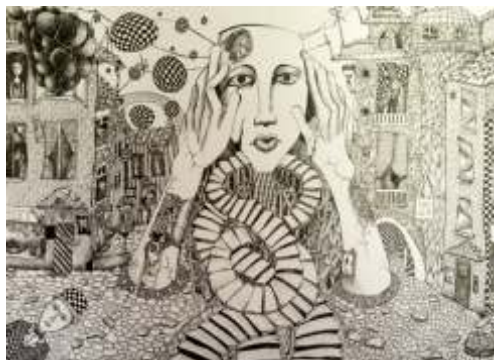
Mikita Hrytskevich Soligorsk, Belarus