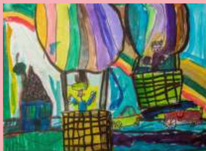
Roland Czirók 7 lat Berettyóújfalu Hungary