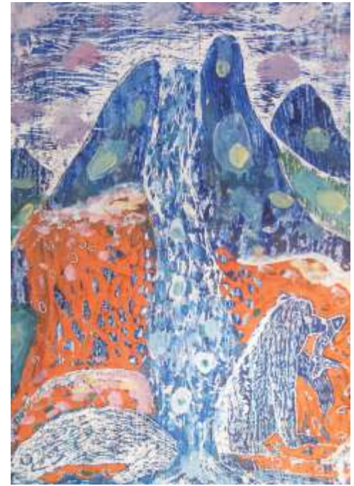
Aleksandr Kovalevskiy Vitebsk, Belarus